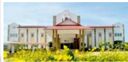
TEMPAT ISTIADAT KONVOKESYEN BERLANGSUNG.