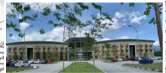
TEMPAT PEMULANGAN PAKAIAN AKADEMIK, PENGAMBILAN TRANSKRIP DAN SKROL.

UNIT PENGIJAZAHAN BAHAGIAN HAL EHWAL AKADEMIK