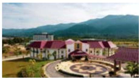
TEMPAT GRADUAN BERKUMPUL.